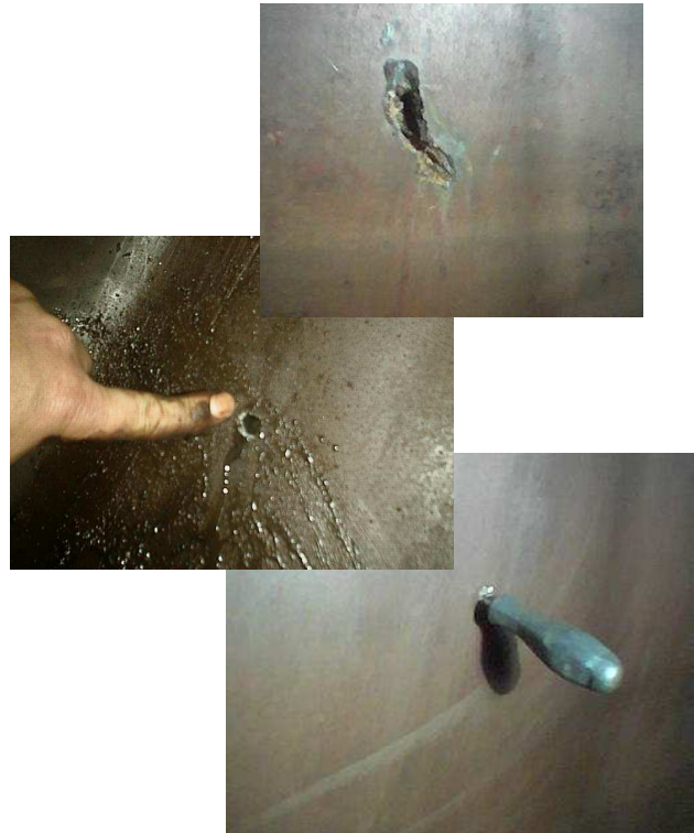
DIVERSAS ALTERACIONES EN LA PARED DE LOS TANQUES